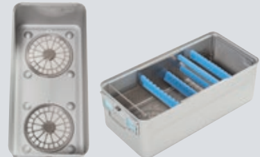
CONTAINER Cod. 260-106-20Y Container con filtri / Container bottom perforated